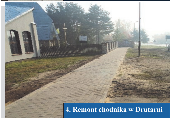
4. Remont chodnika w Drutarni