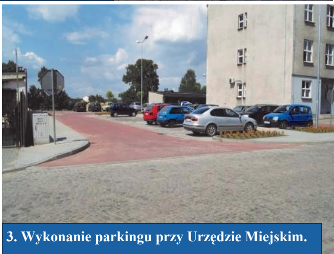
3. Wykonanie parkingu przy Urzędzie Miejskim.