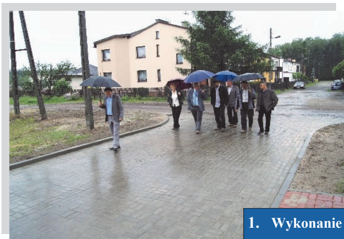
1. Wykonanie ulicy Matejki.

W minionym 2012 roku w naszym mieście dokonano wiele inwestycji oraz remontów infrastruktury drogowej, zarówno w zakresie dróg gminnych jak i powiatowych. Najważniejsze inwestycje na drogach gminnych to: