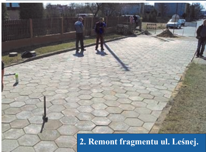
2. Remont fragmentu ul. Leśnej.