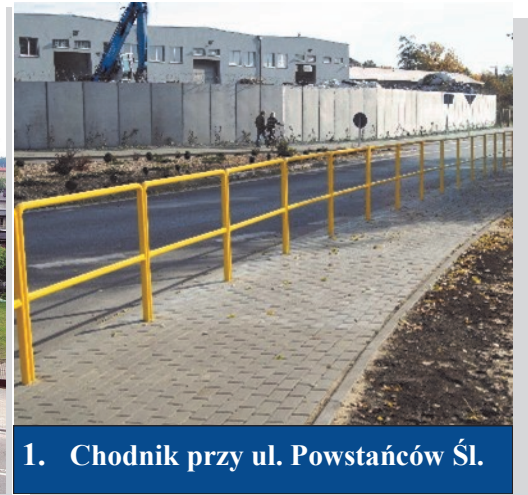
1. Chodnik przy ul. Powstańców Śl.

Niektóre z powyższych inwestycji zostały pokryte w całości przez Zarząd Dróg Powiatowych, zaś niektóre przy wsparciu Miasta Kalety. W nowym roku 2013 planuję poprosić Radę Miejską o kolejne dofinansowanie zadania powiatowego w zakresie utrzymania chodników, co pozwoliłoby na wyremontowanie chodnika na całej długości ul. 1 Maja, począwszy od budynku Urzędu Miejskiego aż do parkingu przy barze „Leśna”. Powodzenie tej inwestycji zależeć będzie od decyzji Rady Miejskiej w Kaletach.