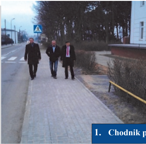
1. Chodnik przy ul. 1 Maja

Na mój wniosek Zarząd Dróg Powiatowych w Tarnowskich Górach wyremontował następujące odcinki chodników: