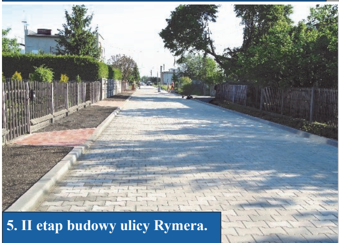
5. II etap budowy ulicy Rymera.